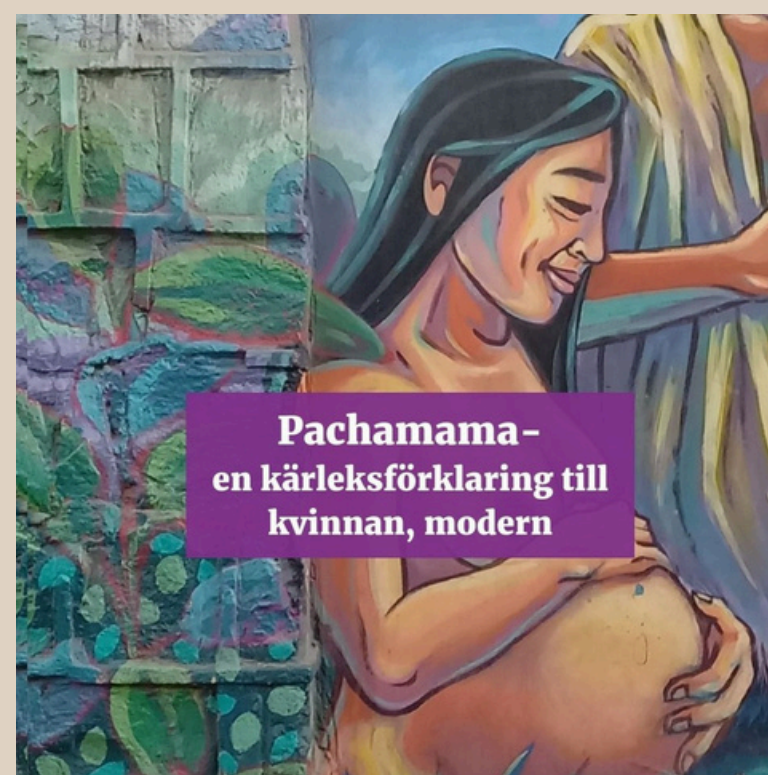
Omslagsbild för krönikan 8 mars. Design: Siim Prääts

Inspirerade av föreningens partnerorganisationer anordnade Latinamerikagrupperna den 2 mars en egen fröbyttardag. Programmet bestod av en heldag i solidaritetens och kvinnokampens anda där besökare tog med och böt egna fröer, sticklingar och andra växtdelar som används för matproduktion. Programpunkterna erbjöd en möjlighet att lära känna gräsrotsrörelsers arbete i Latinamerika och under minglet utväxlades kunskaper och överskott. För de allra minsta besökarna fanns ett planteringsbord där de kunde så sina frön direkt. Kvinnokampen var dagens röda tråd då den symboliserar en kamp för liv och mångfald.