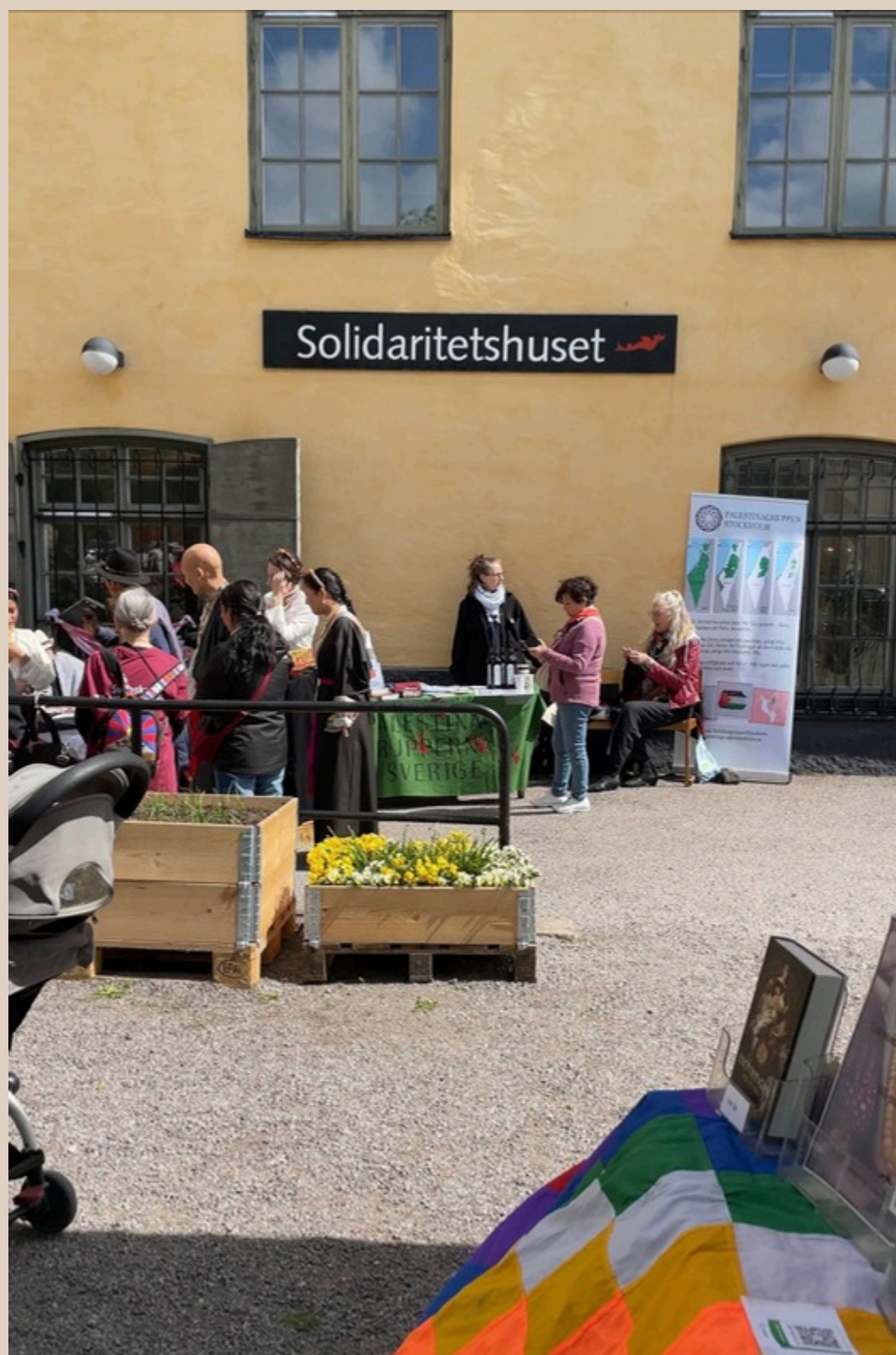
Besökare Drakens dag, Solidaritetshuset i Stockholm.

Latinamerikagruppernas årsmöte hölls den 17 maj 2025 på Solidaritetshuset i Stockholm. De som inte kunde delta på plats kopplade upp sig online via zoom. Efter årsmötet intogs gemensam lunch för att reflektera över det gångna och planera inför det kommande året.