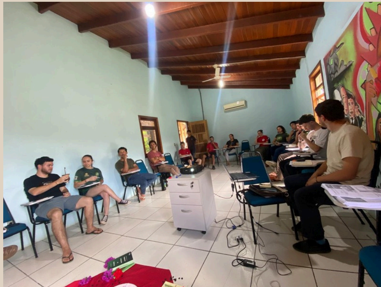
Pågående möte för ungdomar på landsbygden i Rio Grande do Sul, Brasilien, oktober 2025.

Som en första aktivitet genomförde MPA i november i Santa Cruz do Sul i delstaten Rio Grande do Sul ett uppstartsmöte och ett utbildningstillfälle där ungdomar från det lokala samhället deltog. Aktiviteten hade fokus på de sociala rörelsernas historia i Brasilien, med särskild betoning på MPA:s egen utveckling, organisation och politiska arbete. Deltagarna fick även en introduktion till agroekologi och dess betydelse för MPA:s långsiktiga strategi, Plano Camponês, samt för utvecklingen av en hållbar produktionsbas. I detta sammanhang lyftes särskilt ungdomars och kvinnors viktiga roll i organisationens nuvarande och framtida arbete. Betydelsen av generationsförnyelse och av att stärka Feminismo Popular Camponês (folklig småbrukarfeminism) betonades.