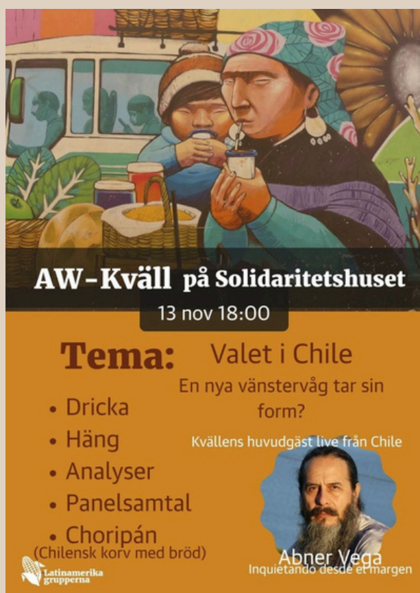
Affisch för AW-Kväll på Solidaritetshuset 13 november 2025. Design: Siim Prääts.