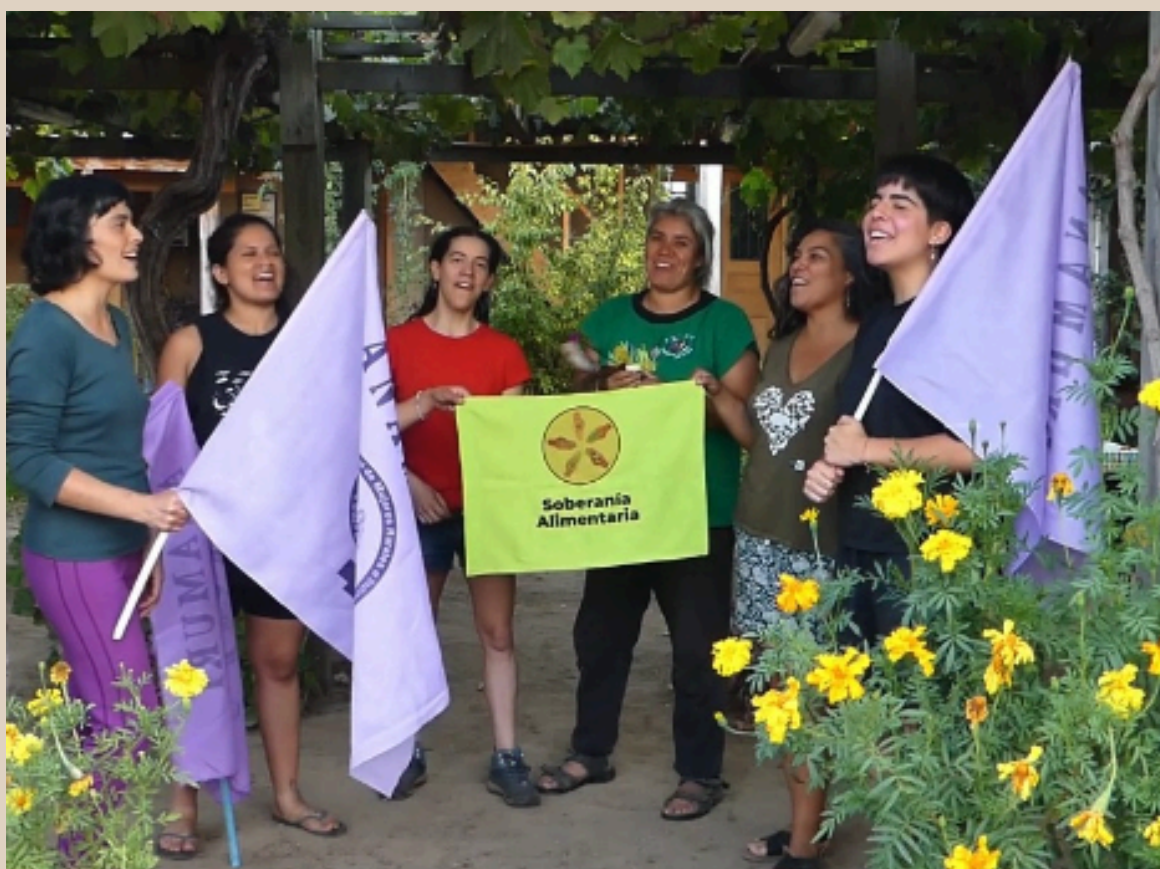
Skärmbild från videohälsning från ANAMURI.