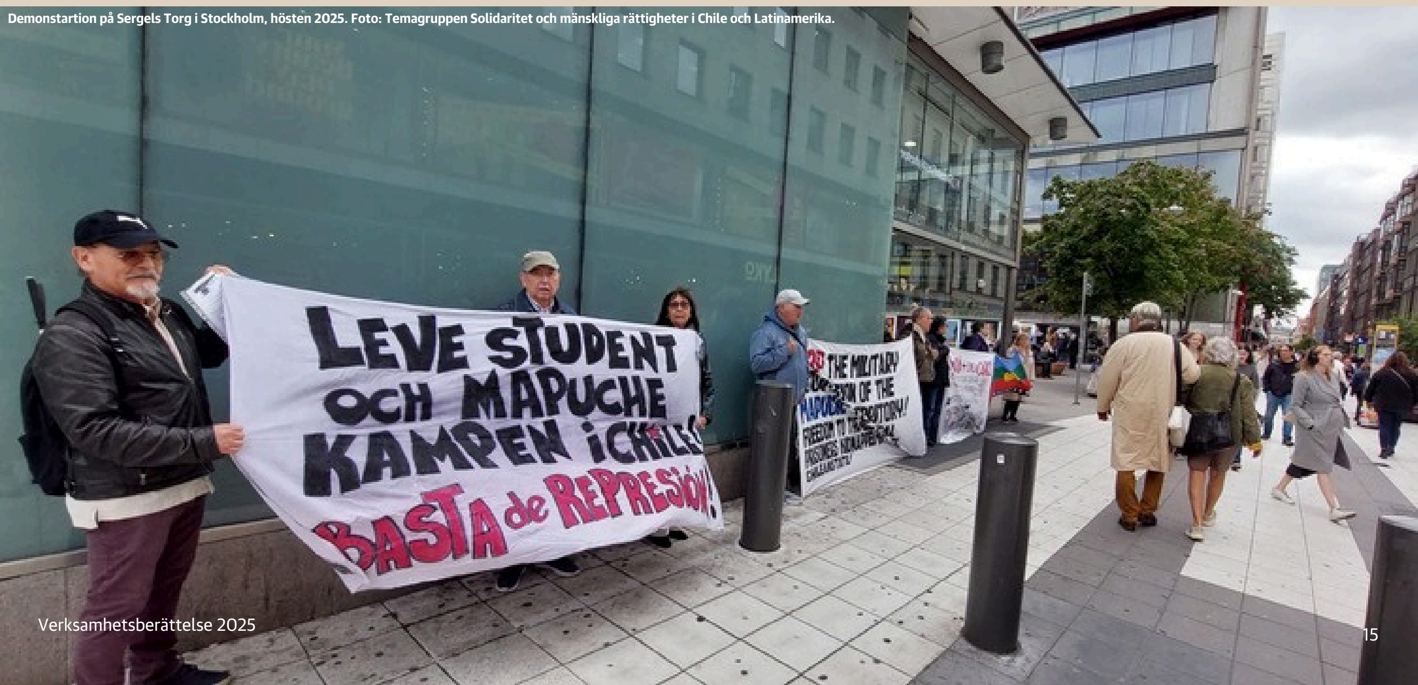
Demonstration på Sergels Torg i Stockholm, hösten 2025.

Väl tillbaka i Sverige efter sommaren organiserade temagruppen flera aktiviteter i Stockholmsområdet.