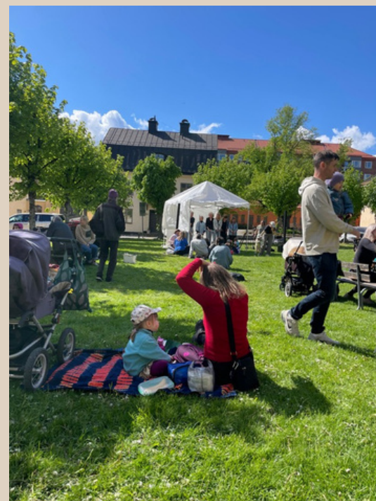
Besökare Drakens dag, utanför Solidaritetshuset i Stockholm.

Latinamerikagrupperna deltog med infobord samt visning av minidokumentären: Ett frö av motstånd producerad av föreningens samarbetsorganisation MPA i Brasilien.