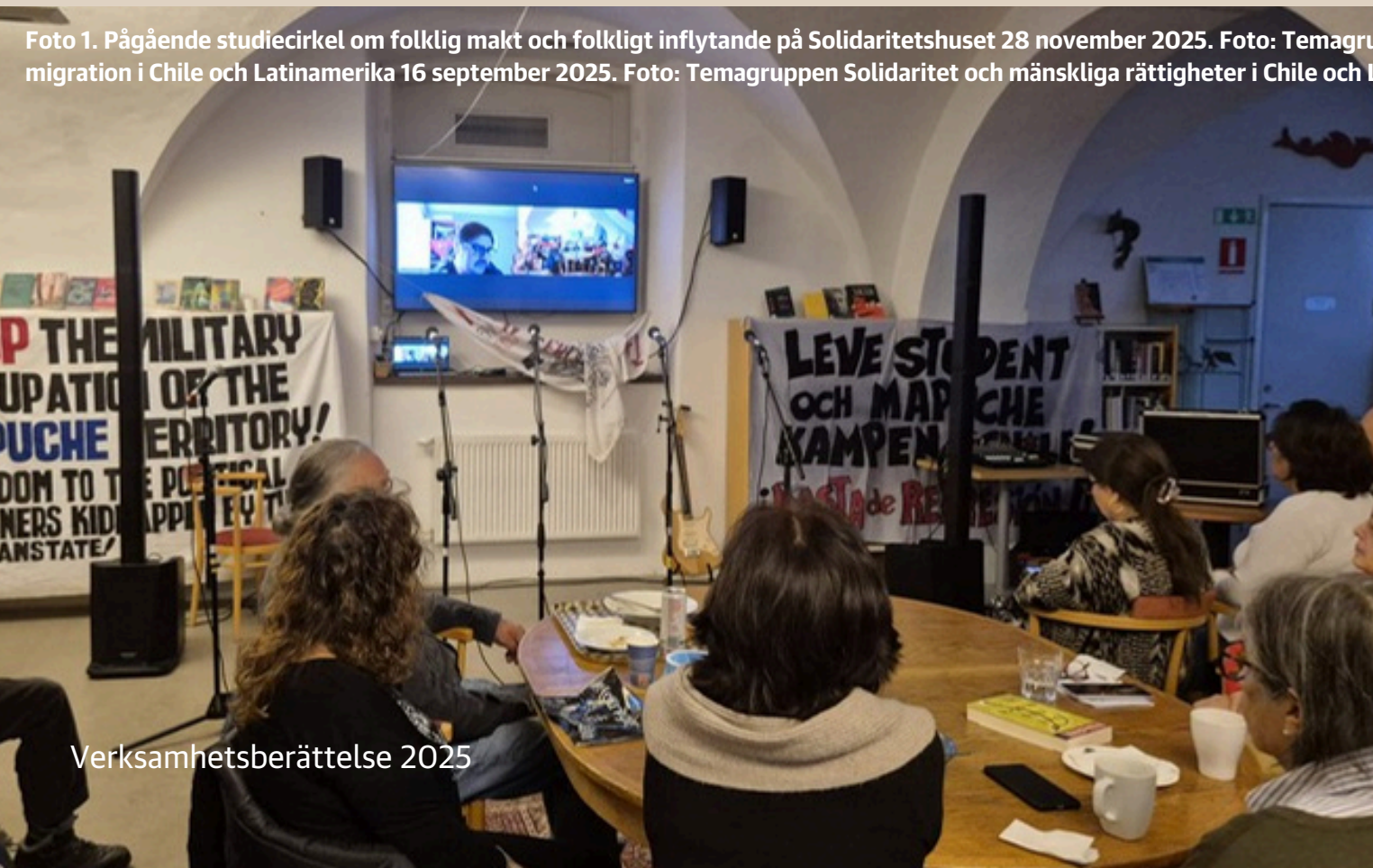
Foto 1. Pågående studiecirkel om folklig makt och folkligt inflytande på Solidaritetshuset 28 november 2025. Foto: Temagruppen Solidaritet och mänskliga rättigheter i Chile och Latinamerika. Foto 2. Pågående workshop om rasism och migration i Chile och Latinamerika 16 september 2025. Foto: Temagruppen Solidaritet och mänskliga rättigheter i Chile och Latinamerika.

Den 28 de november anordnade temagruppen en studiecirkel på temat folklig makt och folkligt inflytande.