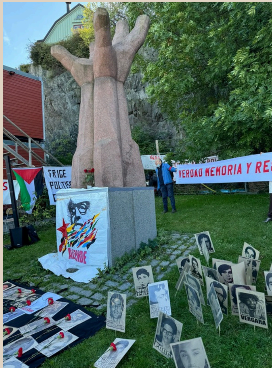
Statyn "La Mano" och bilder på den chilenska civil-militära diktaturens offer, 12 september 2025.