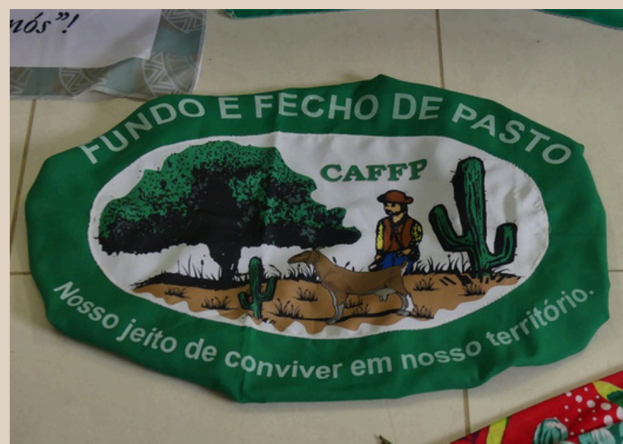
Rörelsen Fundo e Fecho de Pastos flagga, Bahia, Brasilien, juni 2025.

Genom att resa från samhälle till samhälle i länderna Chile och Brasilien och där interagera med representanter för olika folkrörelser bistod han Latinamerikagrupperna i föreningens arbete med att utforska nya möjliga ramar för ett framtida praktikantprogram.