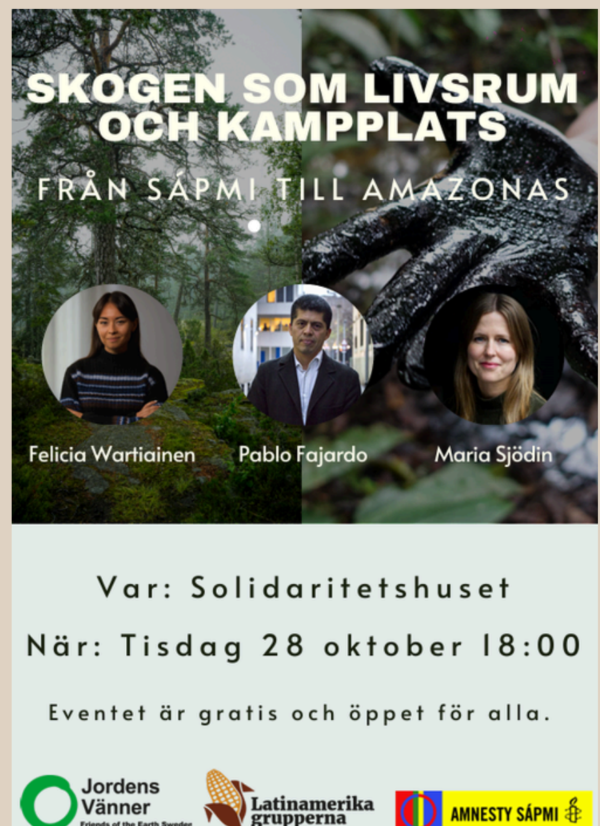
Affisch för panelsamtalet Skogen som livsrum och kampplats.