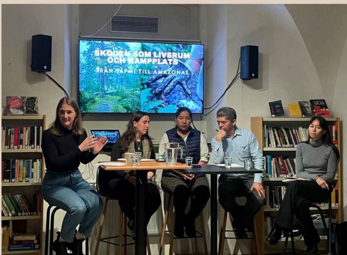
Panelen under panelsamtalet Skogen som livsrum och kampplats.