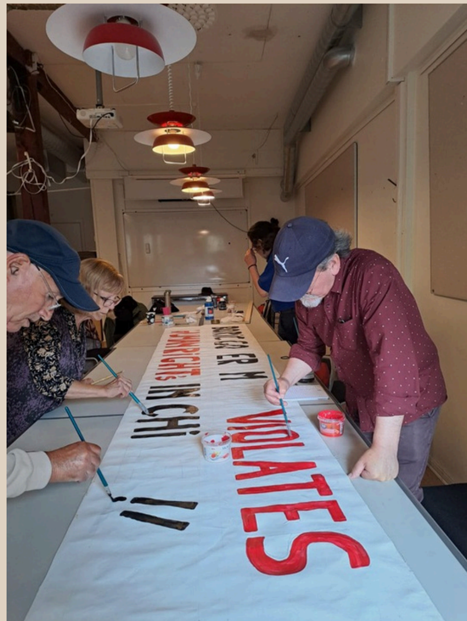
Plakatworkshop på Solidaritetshuset, hösten 2025.

Varje vecka har medlemmar i gruppen ställt sig med banderoller och flygblad i centrala Stockholm för att synliggöra de svåra förhållandena som chilenska och Mapuchefolkets politiska fångar behöver hantera på daglig basis. Aktionen belyser även den chilenska statens hårda förtryck av sociala rörelser, studenter, invånare i utsatta områden, klimataktivisterna och fackrepresentanter.