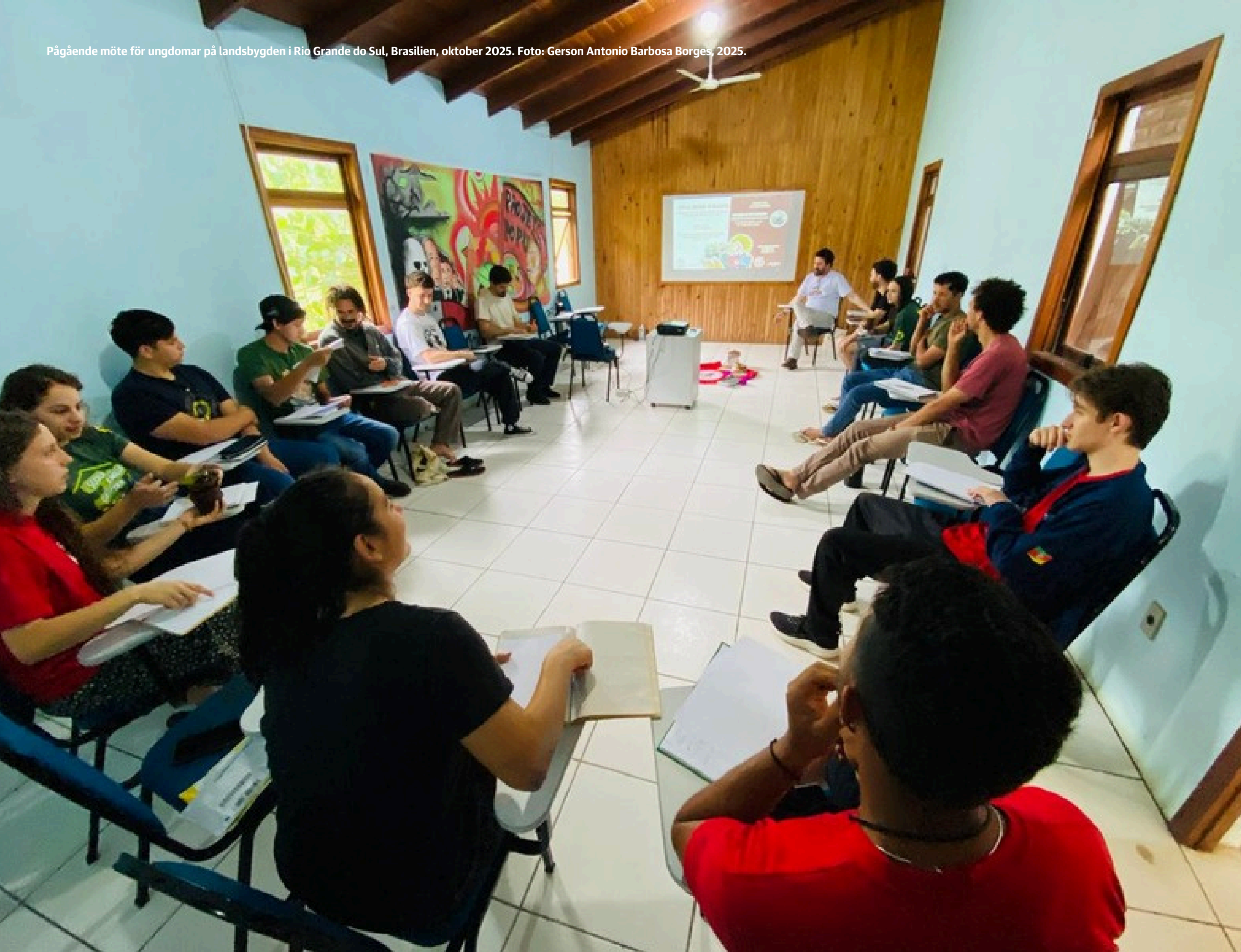
Mötesdeltagare, möte för ungdomar på landsbygden i Rio Grande do Sul, Brasilien, oktober 2025.