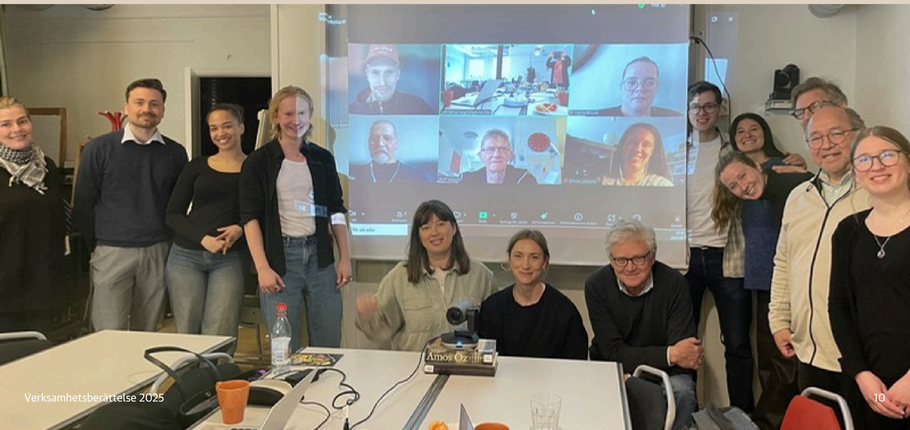
Deltagare på årsmötet den 17 maj 2025.

Från och med nu får medlemmar som vill ta del av föreningens arkiv söka sig till Riksarkivet