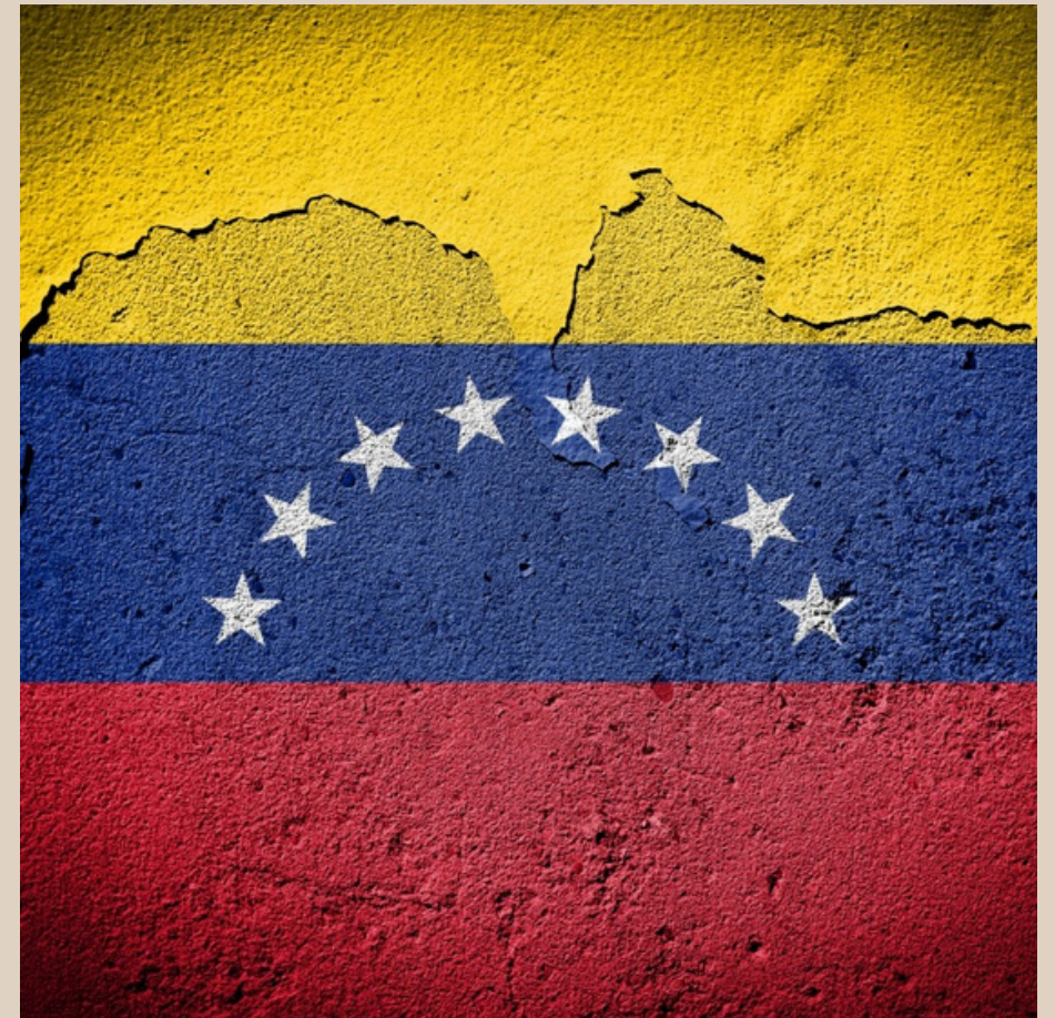
Bild som publicerades i samband med fördömmande av USAs militära och politiska våld i Venezuela

https://www.latinamerikagrupperna.se/2025/12/fordomande-av-usas-militara-och-politiska-vald-i-venezuela/