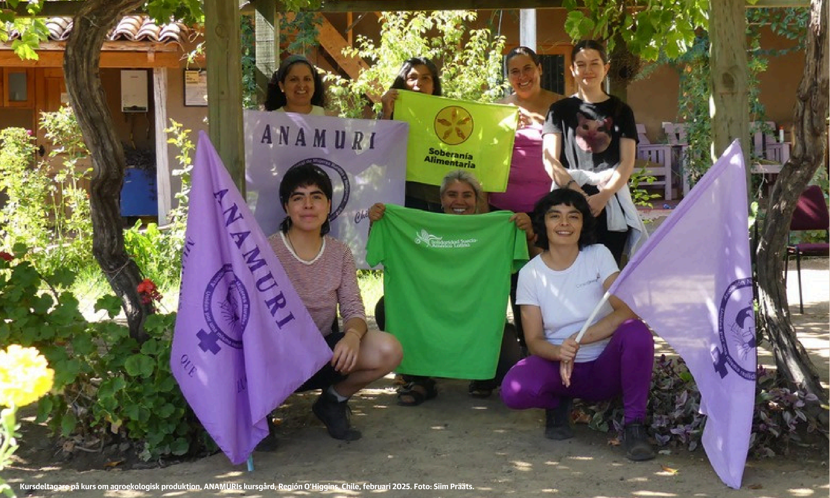
Kursdeltagare på kurs om agroekologisk produktion, ANAMURIs kursgård, Región O'Higgins, Chile, februari 2025.