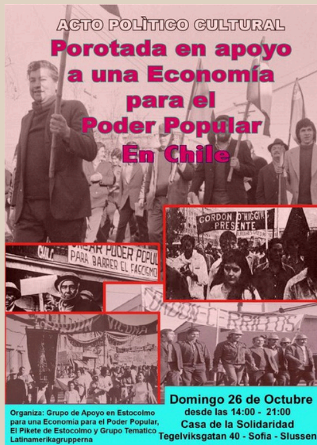
Affisch för Politisk/kulturell chilensk kväll med traditionell chilensk mat på Solidaritetshuset 26 oktober 2025.