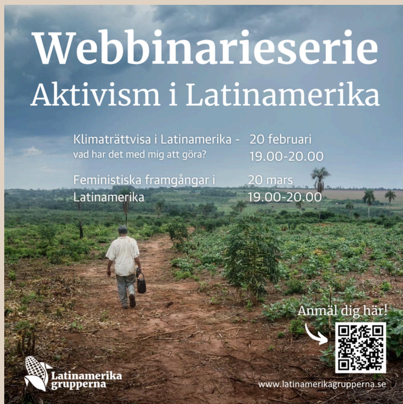
Affisch för Latinamerikagrupperna webinarium i februari och mars.

Deltagaruppföljningen visade på bra respons, med fina betyg och hög andel som uppgav att de lärt sig mycket genom samtalen.