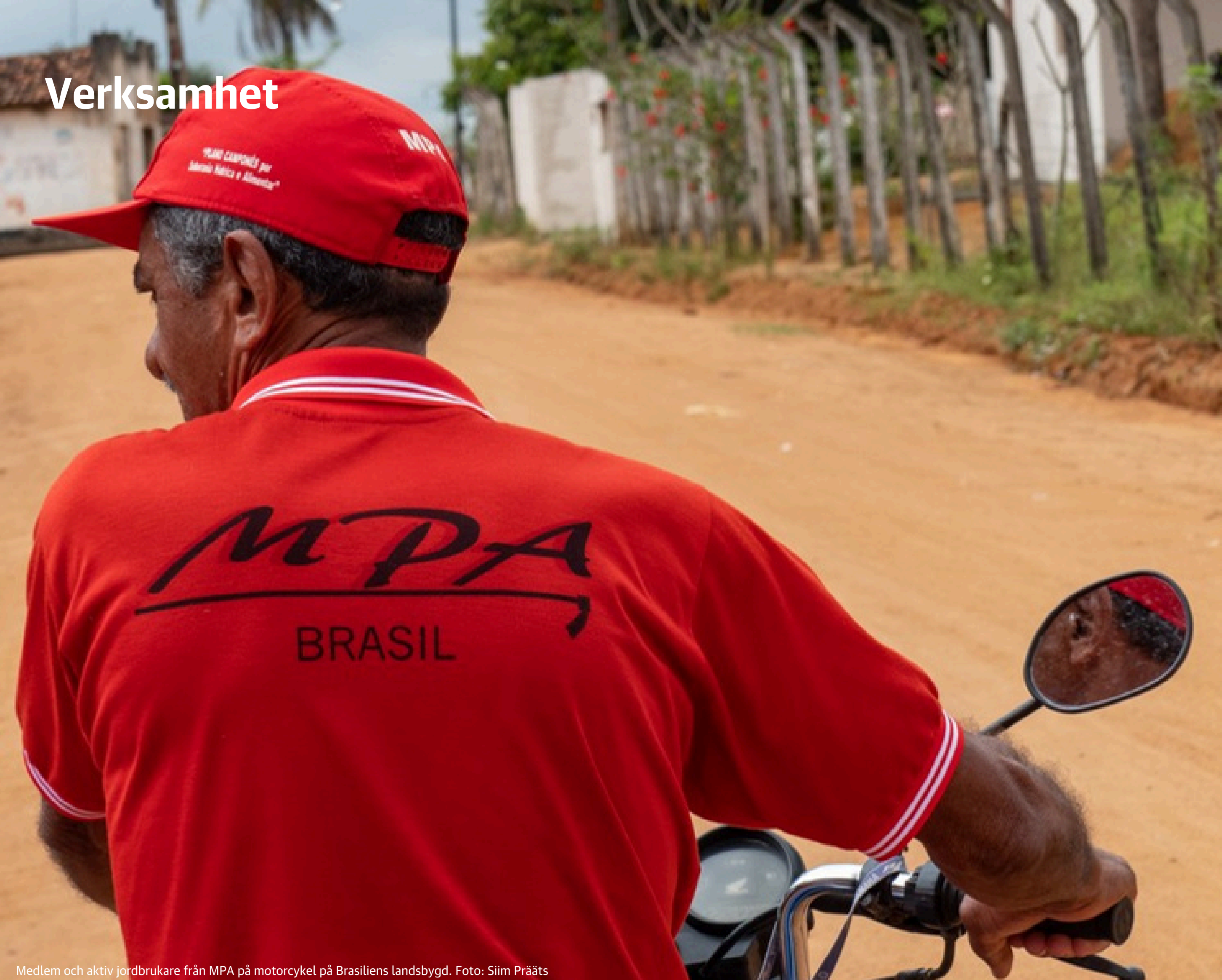
Medlem och aktiv jordbrukare från MPA på motorcykel på Brasiliens landsbygd.